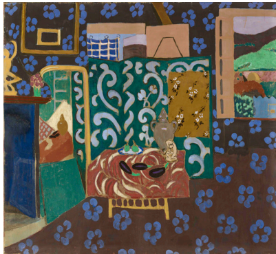
Henri Matisse, Intérieur aux aubergines , 1911, Musée de Grenoble.

Il en va de même, enfin, du moment qui suit l'accomplissement, au moins partiel, du travail du peintre. Il est plus difficile d'alléguer sur ce point des témoignages théoriques. Il faudrait sans doute citer de longues pages très justes d'un roman de John Berger, A Painter of Our Time , qui constitue à nos yeux une des analyses conceptuellement les plus lucides de ce qui se passe dans un atelier, entre le peintre et la toile. Risquons plutôt à ce propos une ekphrasis, à défaut d'une analyse phénoménologique beaucoup plus longue et sans doute plus difficile à porter à la parole. Avec L'Atelier rose , La Famille du peintre et L'Atelier rouge , l'Intérieur aux aubergines s'inscrit dans une série de tableaux peints par Matisse en 1911.