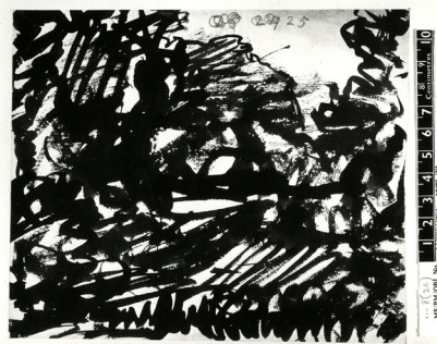
Alexander Cozens, ' Blot ' drawing, British Museum, London.