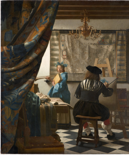
Jan Vermeer, Allégorie de la peinture , Kunsthistorisches Museum, Vienna.

Il s'agit presque d'un objet transitionnel: certes, c'est la main du peintre, mais, en raison du brouillage des traits et de l'analogie des couleurs, on peut y reconnaître aussi l'esquisse du visage du modèle, qui commence à se profiler sur la toile. De sorte que la main de l'ouvreur et la matière de l'ouvrage se confondent. Mais dans cette main floutée, il conviendra de reconnaître aussi la trace d'une expérience d'attention-et-inattention qui gît au fond du travail pictural: car l'attention au sujet à peindre relègue dans l'inattention la toile et condamne à la périphérie du regard, où la vue se brouille, la perception de sa propre main. Au rebours, lorsque le